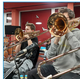
Probe im Haus der Musik